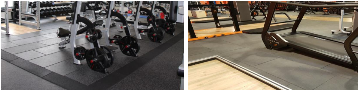
Verwendung von Rand- und Randeckprofilen; Einfassung aus Metall

Die gesamte Fläche muss zu allen Seiten fixiert sein, damit sich die Platten nicht bewegen können. Bei offenen Kanten sollten die SPORTEC® edge- & corner ramps verwendet werden oder eine Fixierung durch eine Metallleiste hergestellt werden.