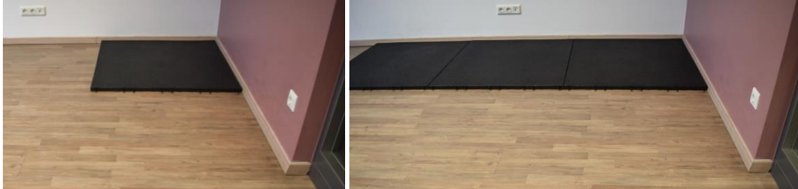
Verlegung der Platten entlang einer graden Wand mit den Steckverbindern nach vorne