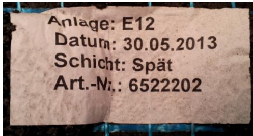
Charge-Aufkleber auf der Plattenunterseite

Bei Beanstandungen bezüglich falsch gelieferter Ware, fehlerhafter Ware, falscher Liefermengen oder sonstigen möglichen Fehlern ist die Ware sofort zu beanstanden und der Einbau ist sofort zu unterbrechen. Eine Reklamation ist nur im unverarbeiteten Zustand unter Angabe der Produktions-Charge möglich. Diese ist wie unten zu sehen auf einem Etikett auf der Unterseite der Platte aufgedruckt.