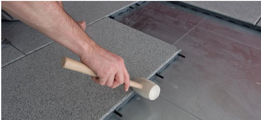
Schließen von Lücken mit einem Hammer

Beim Verlegen darauf achten, dass keine Fugen oder Spalte zwischen den einzelnen Platten entstehen. Dazu mit Hilfe eines (Gummi)-Hammers die Lücken schließen damit die Platten bündig aneinander liegen.