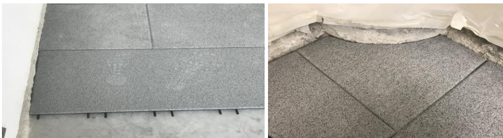
Die zweite Reihe um eine halbe Platte versetzt beginnen; Zuschnitt einer Rundung

Zu Beginn der Verlegung entlang der Kreidelinie, Randeinfassung oder Kante Platte an Platte nebeneinander legen so dass keine Fuge zwischen den Platten gelassen wird und die Steckverbinder nach vorne abstehen. Die zweite Plattenreihe um eine halbe Platte versetzt beginnen, so dass die Platten im T-Fugen Verbund verlegt werden können.