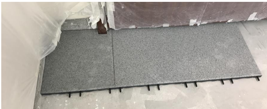
Verlegung der Platten entlang einer graden Wand mit den Steckverbindern nach vorne

Die erste Platte an die Wand / Randeinfassung legen und dann mit der Verlegung starten. Gegebenenfalls ist vorher eine gerade Kante für das saubere Anlegen der Platten an einer Wand oder im Raum herzustellen. Bei Rundungen und Kanten die Platten in die jeweilige Form zuschneiden und die Platte an dieser Stelle bündig anlegen.