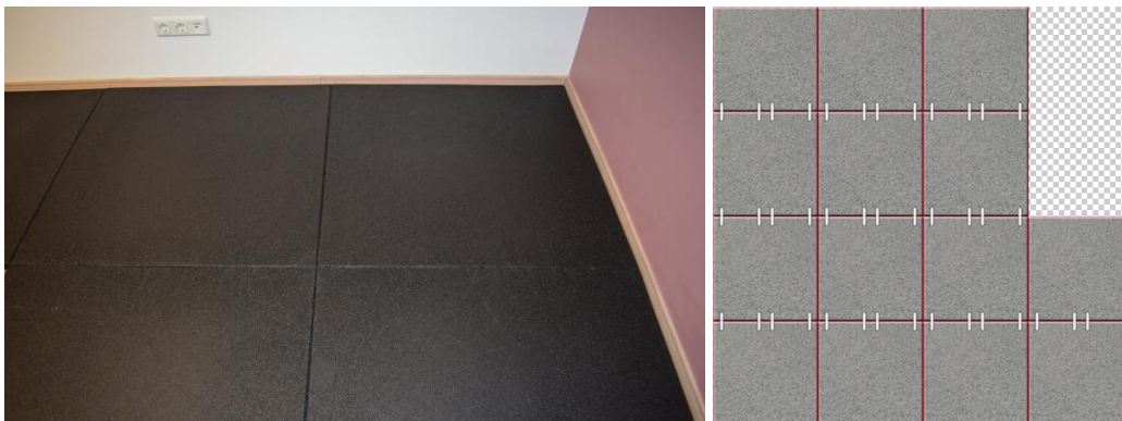
Platten zusammendrücken; Verlegung der Platten im Schachbrettmuster