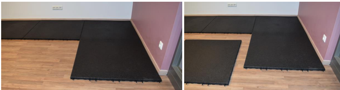
Die zweite Reihe mit den Platten genauso beginnen und fortfahren; Platte neben Platte legen